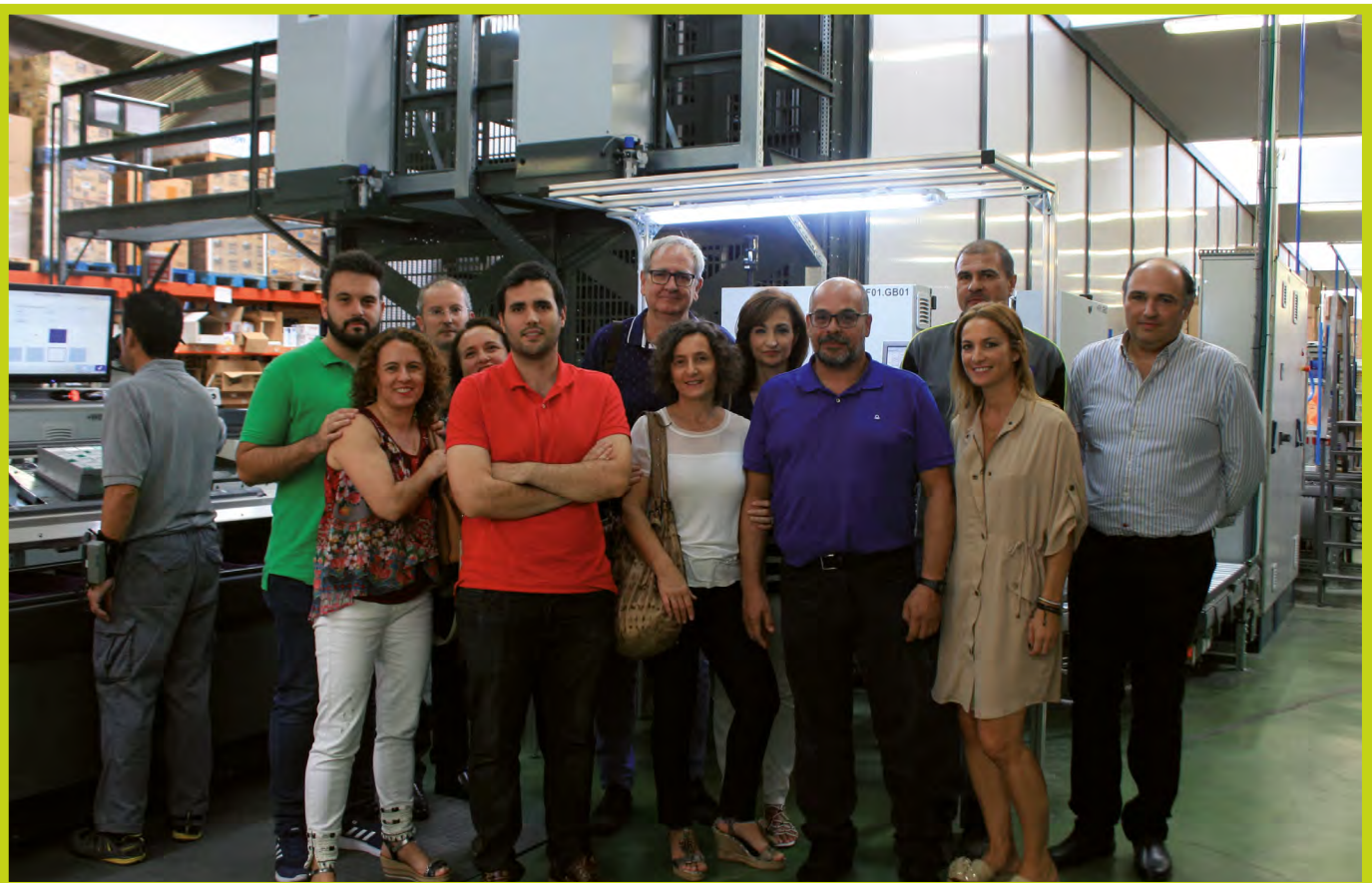
Asistentes a la iniciativa "Con ocho basta" en Almería.