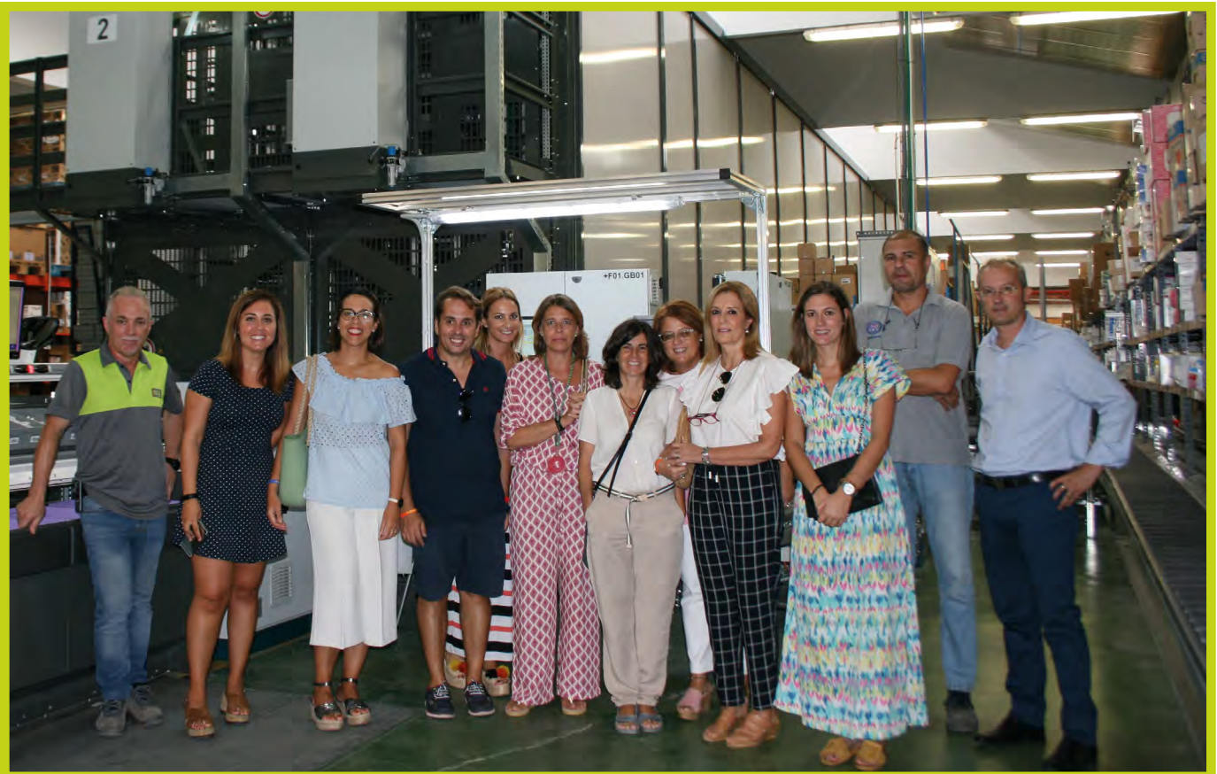
Asistentes a la iniciativa "Con ocho basta" en Almería.