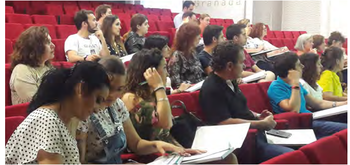
Asistentes a la charla.

Gasteel, Gasteel kid y Gasteel Plus son los simbióticos adecuados para la “salud intestinal” 1 . Los utilizaremos después de tratamientos antibióticos y otras circunstancias en las que sospechemos alteración de la microbiota intestinal que producen sintomatología digestiva o una respuesta inmune deficiente. Gasteel Plus, posee una cepa probiótica, Bifidobacterium longum ES12, con propiedades antiinflamatorias que ha demostrado su efecto beneficioso en procesos que cursen con inflamación intestinal como es la celiaquía. Se sabe que en el paciente celíaco, no solo hay una alteración de la respuesta inmune a la gliadina de ciertos cereales como el trigo,