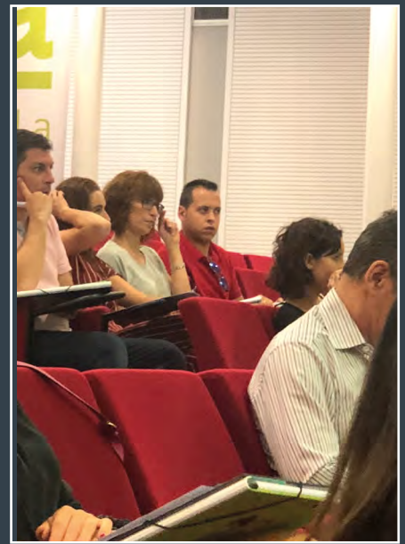
Diferentes momentos de la jornada formativa.